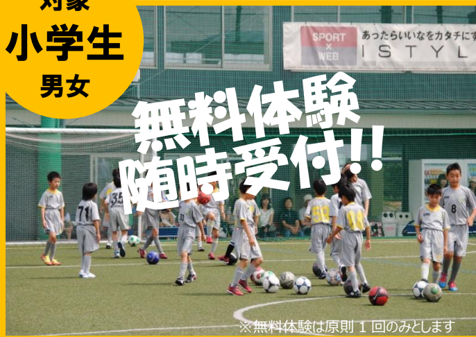
※無料体験は原則 1 回のみとします